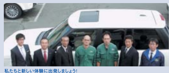
私たちと新しい体験に出発しましょう!

ランドローバー町田周辺にあるアウトドアスポーツ施設やイベントを厳選してご紹介いたします。心身の鍛錬・リフレッシュに、あるいは新鮮な刺激を求め、充分に整備されガレージで翼を休めているランドローバーを駆って、是非お出かけください。